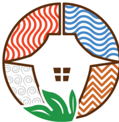
Gambar 1. Logo final kampung keramik Dinoyo Malang.

Penemuan insight daripada pengembangan brainstorming kemudian diwujudkan menjadi beberapa gambar sketsa hingga pada akhirnya melalui tahap diskusi dipilihlah salah satu desain logo yang mampu mewakili konsep tentang identitas kampung keramik Dinoyo. Logo dirancang memunculkan gaya tradisional Jawa Timur dengan visualisasi unsur alam, memiliki kesan ramah yang diimplementasikan pada penggunaan warna, namun dapat diimplementasikan di media apa saja.